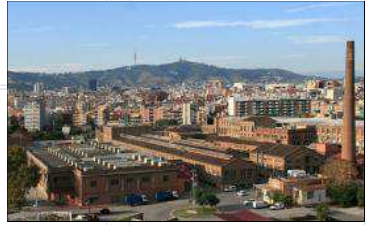
Los viejos complejos industriales también son estudiados.

MÁS DE 10.000 PERSONAS de cerca de 92 países estudian en el IED cada año, por lo que la cerámica tendrá a través de este canal un camino para mostrar su eficacia. Se trata, pues, de una buena iniciativa, como así lo han sabido ver las empresas castellanenses para promocionarse en el exterior. Puede que sea una tabla de salvación de la industria, en plena crisis.