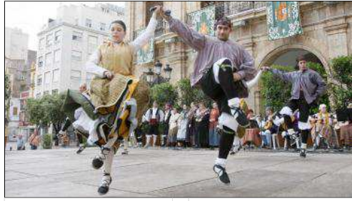
La plaza Mayor ha acogido durante el fin de semana el festival.

nalmente, se llevarán a cabo. Aunque las acciones de promoción de la cerámica castellanense en sus más variadas vertientes son múltiples, ahora se suma la iniciativa de este proyecto con el Instituto Europeo de Diseño, IED. Se trata de una institución de gran prestigio ya que nació en Italia hace más de 40 años como una entidad especializada en el sector de la formación, el desarrollo y también de la investigación en el ámbito del diseño.